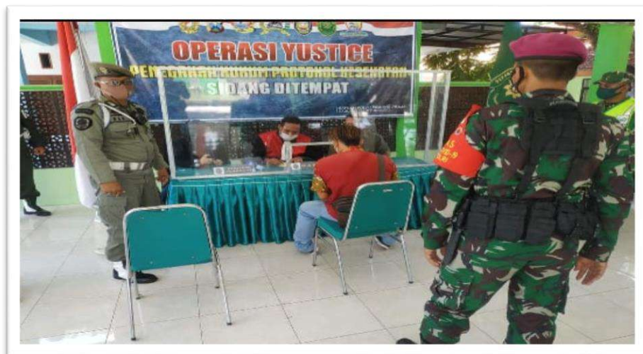
Gambar 2-3 Dokumentasi Sidang Yustice Pandemi Covid 19 (1)

Pengadilan Negeri Situbondo Kelas IB dapat melaksanakan sidang keliling atas permintaan instansi terkait sehingga dalam hal sidang keliling dengan pelaksanaan Sidang ditempat tempat umum / jalan umum bersama Polres Situbondo, DLLAJ Kabupaten Situbondo, SATPOL PP Kabupaten Situbondo dan KODIM khususnya Operasi Yustitia bagi Masyarakat yang tidak mempergunakan masker ( Pandemi Covid 19) ditempat atau dijalan umum ditahun 2020, melaksanakan sidang keliling sebanyak 9 ( Sembilan ) yaitu : 14,15,16,18,21,22,23,29 September 2020 dan 12 Oktober2020 .