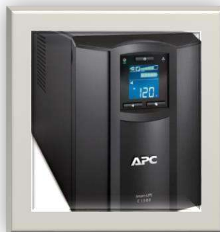
Gambar 4- Uninterruptible Power Supply ( UPS )

Pengadilan Negeri Situbondo Kelas IB belum memiliki rak server, namun menggunakan meja portable , dan yang terdapat pada meja portable tersebut adalah meliputi 2 unit server, modem ( idihome kecepatan 100 mbps dan Astinet Dedicated 1: 1 kecepatan 50 Mbps, 1 unit DVR CCTV ( 16 Port ), dan 1 unit switch /hub, telah dihubungkan dengan 2 unit UPS, dengan spesifikasi sebagai berikut: