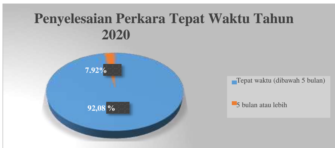
Gambar 2-1 Grafik Penyelesaian Perkara sesuai SEMA No. 2 Tahun 2014

jumlah tersebut, 581 perkara telah diselesaikan tepat waktu (kurang dari atau sama dengan 5 bulan).