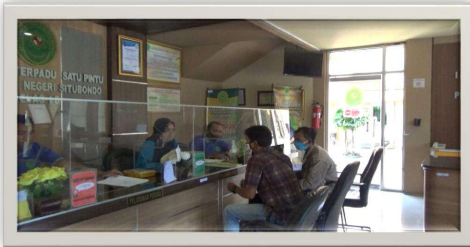
Gambar 5-2 PTSP di Pengadilan Negeri Situbondo Kelas IB