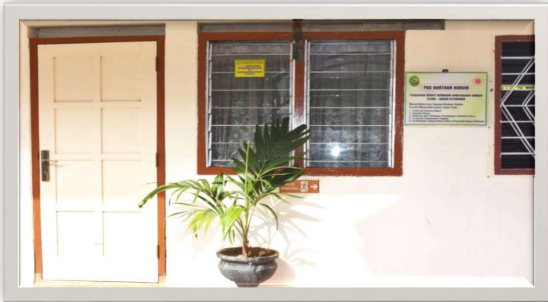
Gambar 2-2 Ruang Pos BAKUM