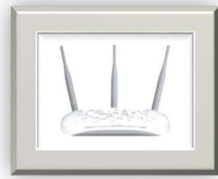
Tabel 4-10 Daftar Perangkat Jaringan Komputer