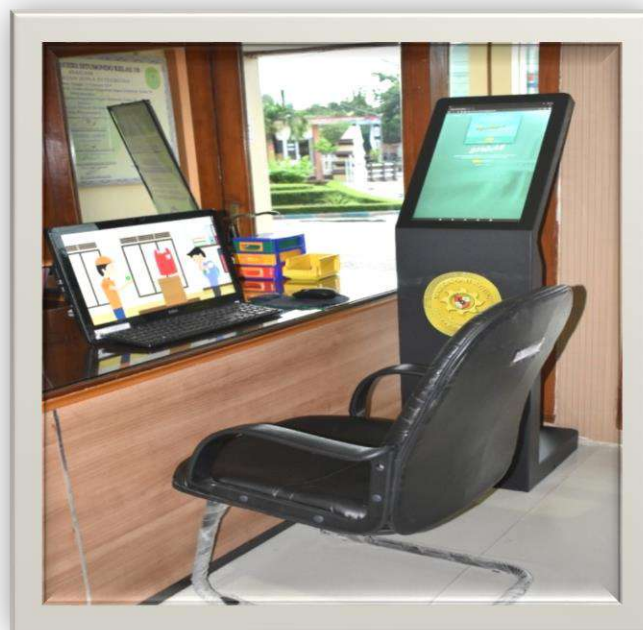
Gambar 5-4 PC Pojok E-Court dan Vestouch untuk informasi publik