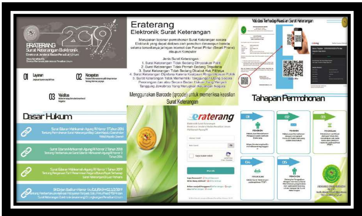
Gambar 5-7 Brosur Eraterang

Tahun 2018 tentang pemberlakuan SEMA No. 3 Tahun 2016 , serta Surat Keputusan Direktur Jenderal Badan Peradilan Umum Mahkamah Agung R.I. Nomor : 44/DJU/SK/HM02.3/2/2019 tentang Pemberlakuan Aplikasi PTSP+ dan Surat Keterangan Elektronik ( Eraterang ) di lingkungan Peradilan Umum maka masyarakat yang akan mengajukan Surat Keterangan dimaksud dapat melakukan elektronik (eraterang). Aplikasi ini dapat diakses pada alamat : https:// eraterang.mahkamahagung.go.id/ .