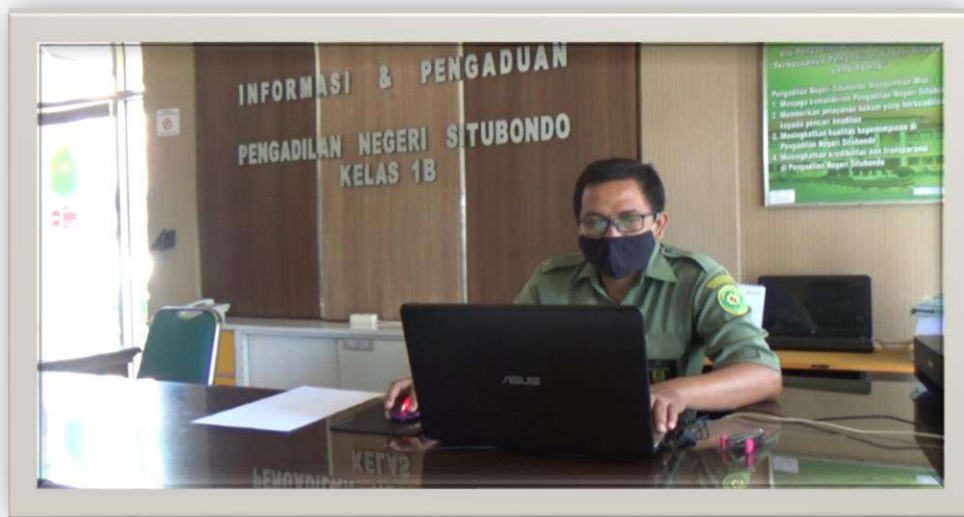
Gambar 5-3 Pojok E-Court dan Penandatanganan Upaya Hukum di Pengadilan Negeri Situbondo Kelas IB