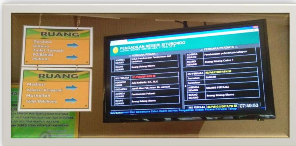
Gambar 5-6 Monitor Jadwal Sidang