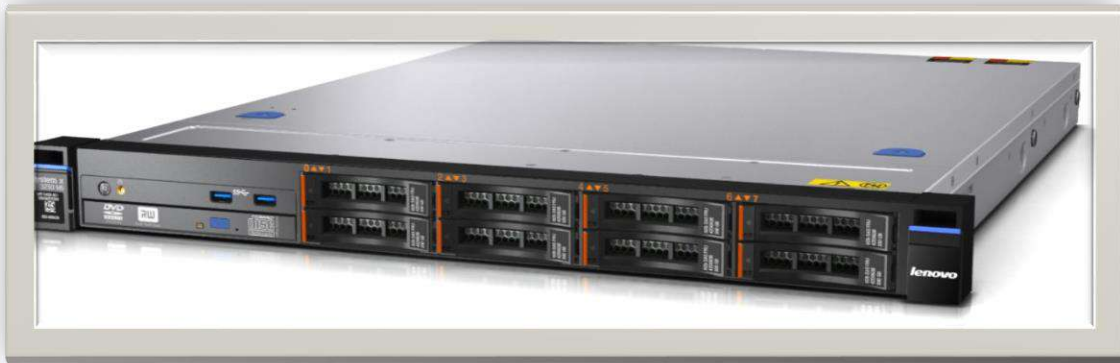
Gambar 4-1 IBM Lenovo Manufacture System x3250 M5 Rack Server