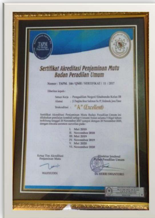
Gambar 5-1 Sertifikat Akreditasi Penjaminan Mutu

Mahkamah Agung dalam hal ini memberikan suatu penilaian atau Sertifikasi Penjaminan Mutu atau standarisasi pelayanan kepada peradilan dibawah dan berdasarkan beberapa komponen yang dinilai diantaranya, Kebersihan, sarana prasana penunjang / fasilitas, kepatuhan pelayanan, percepatan pelayanan , penyelesaian perkara melalui SIPP, sehingga memberikan pelayanan maxsimal kepada masyarakat dengan memaksimal anggaran DIPA yang ada, Pengadilan Negeri Situbondo Kelas IB telah mendapatkan Sertifikasi Akreditasi Penjaminan Mutu Badan Peradilan Umum Makassar pada tanggal Nopember 2017 dengan Nilai A Excellent dan Sertifikasi Akreditasi Penjaminan Mutu dievaluasi secara berkala 6 ( enam ) bulan sekali oleh Peradilan diatasnya yang ditunjuk / Pengadilan Tinggi Jawa Timur.