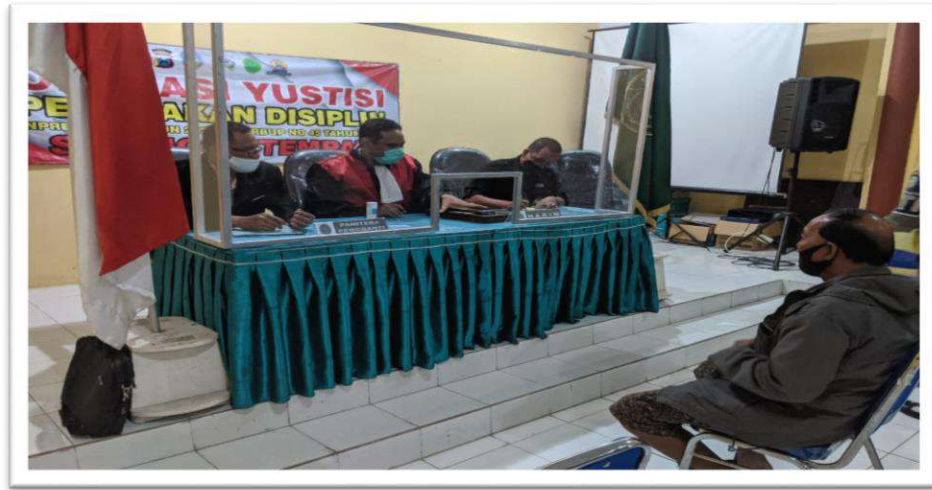
Gambar 2-3 Dokumentasi Sidang Yustice Pandemi Covid 19 (2)