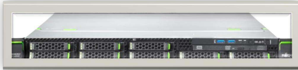
Gambar 4-2 Fujitsu PRIMERGY RX1330 M2 Server

Server ini di gunakan untuk Server aplikasi dengan Operating System Linux Centos 7 di dalamnya terinstal aplikasi Sistem Informasi Penelusuran perkara ( SIPP ), Sistem Pelayanan Terpadu Satu Pintu ( PTSP )