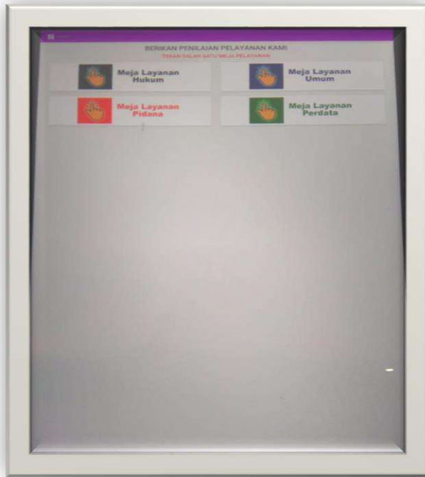
Gambar 5-5 Tampilan Vestouch untuk Indeks Kepuasan Masyarakat